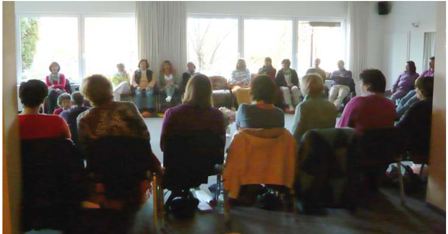
Seminarhotel Odenwald, Am Dachsrain 2, 64739 Hassenroth